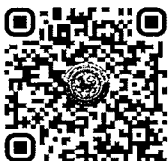
แบบตอบรับ

สำนักงานส่งเสริมการปกครองท้องถิ่นจังหวัด กลุ่มงานส่งเสริมและประสานงานท้องถิ่นอำเภอ โทรศัพท์/โทรสาร ๐ ๕๓๑๑ ๒๖๐๘ https://chiangmailocal.go.th