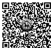
สิ่งที่ส่งมาด้วย ๑-๒